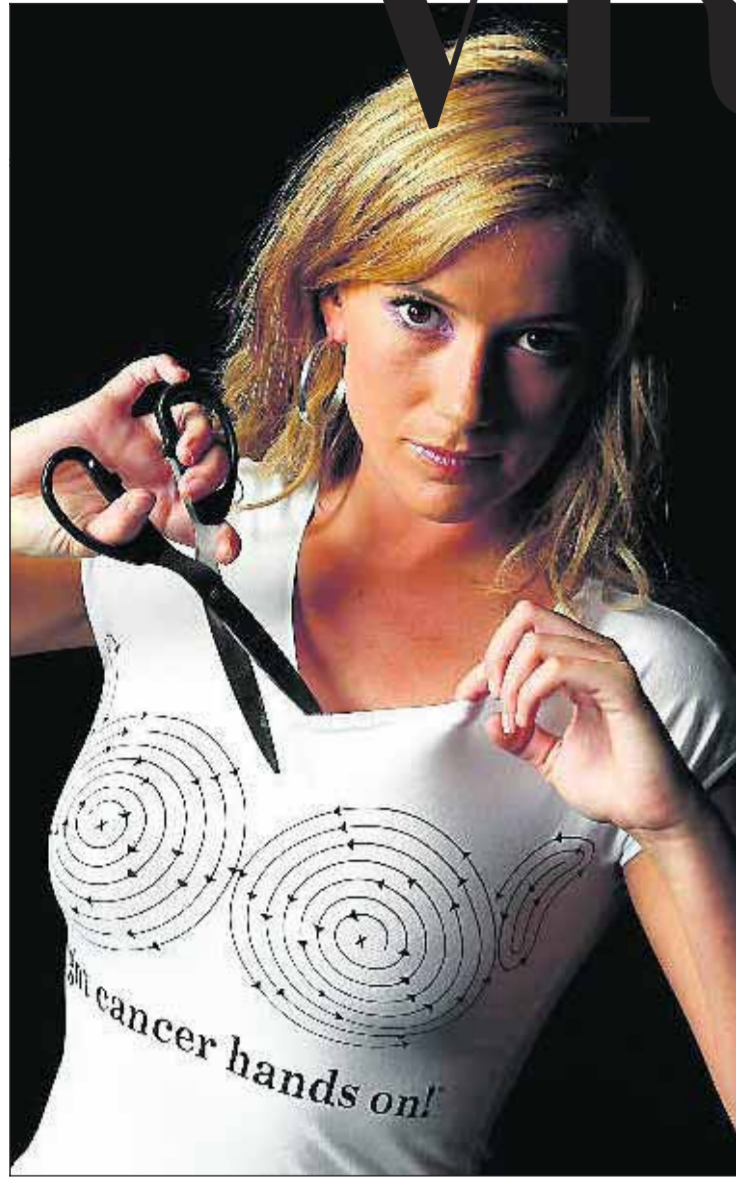
■ Volgens de KWF Kankerbestrijding is het niet langer nodig dat vrouwen zelfonderzoek doen.