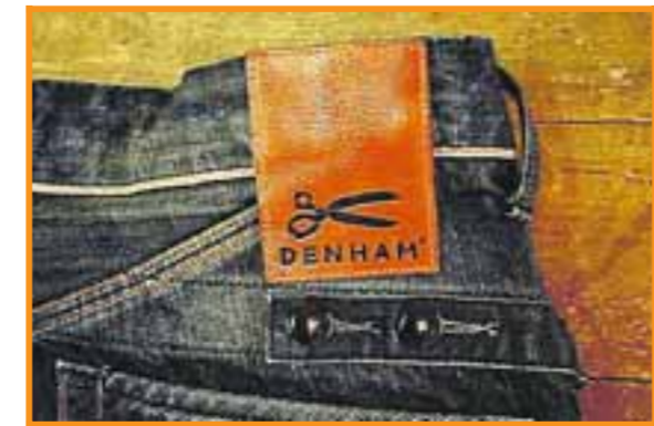
■ Een mix van vintage en modern van het nieuwe merk Denham.