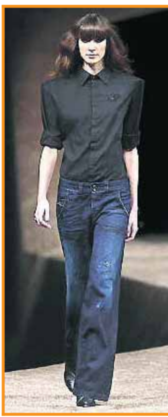
■ Flares, broeken met uitlopende pijpen, zijn een succes bij Diesel.

Het Nederlandse G-star scoort al seizoenenlang internationaal goed. Ze openen wereldwijd eigen winkels en erdaags gaan er ook G-star winkels in eigen land open. Denham, van jeanskenner Jason Denham, is een nieuw merk waar denimliefhebbers tot ver over de grens likkebaardend naar kijken. In het verleden maakte Jason jeans voor de rockband U2, Pepe Jeans en later ook voor het Nederlandse Blue Blood. „Er zijn inderdaad al veel mooie spijkerbroekenmerken, maar er is nog ruimte voor een echt goede jeans waar je kippenvet van krijgt”, zegt de expert. „Bijzonder aan mijn creaties zijn de details, de wassingen en de puurheid van de spijkerbroek. Veel jeansmakers weten niet wanneer ze moeten stoppen. Ik vergelijk het met koken: stop je te veel ingrediënten in een gerecht dan smaakt het niet meer. Datzelfde geldt ook voor jeans.”