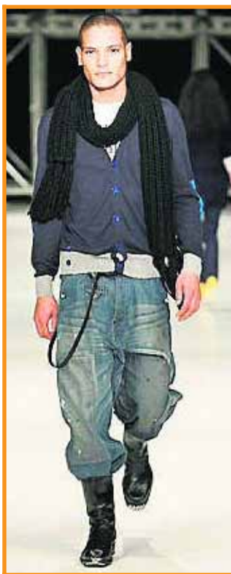
■ De grootste inspiratie voor de huidige Blue Blood collectie is de 'celebration' van klassieke stijl en ouderwets ambacht.

Na de hoos van Italiaanse (Replay, Miss Sixty, Adriano Goldschmied), Zweedse (Cheap Monday, Acne Jeans) en Amerikaanse (Seven, Paige Premium Denim, Citizens Of Humanity) merken timmeren nu de Nederlandse jeansmerken aan de weg.